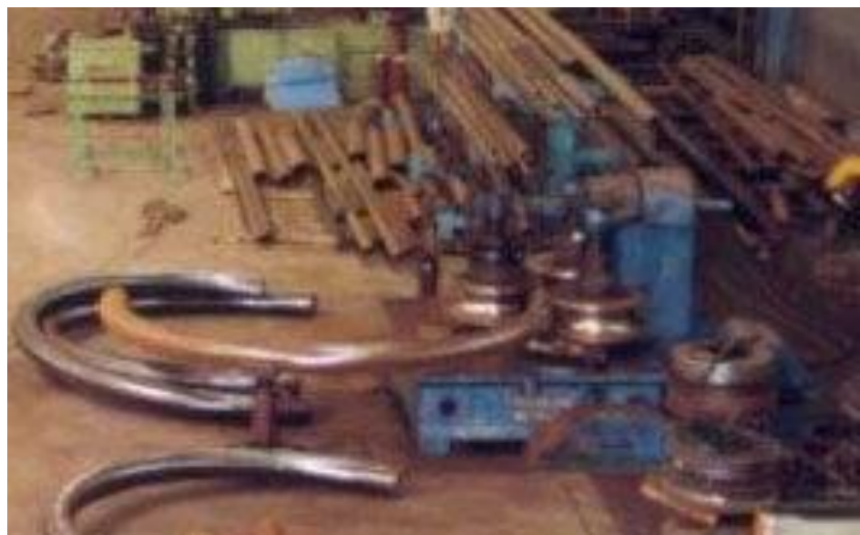
Cintreuse HERCULES BO 234 K