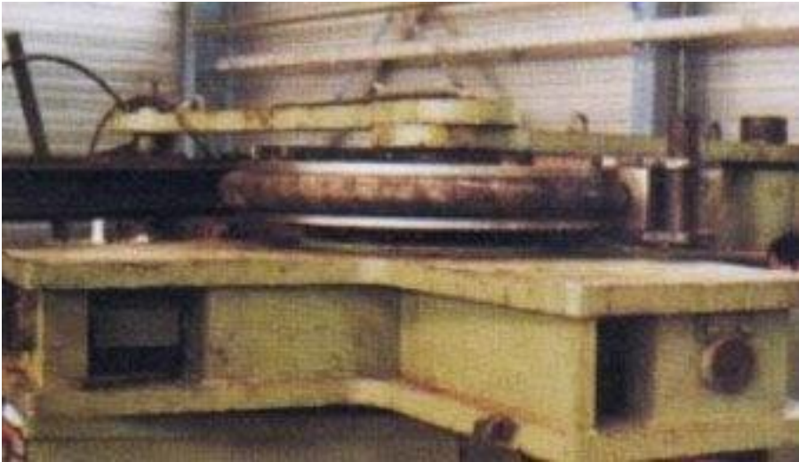
Cintreuse VENOT - PIC